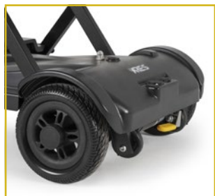
Ruedas macizas con antivuelco.