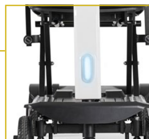
Luz led delantera.