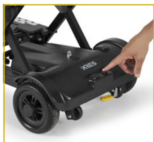
Opción de plegado electrónico sin mando.