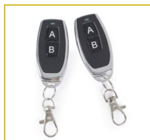
2 mandos incluidos.