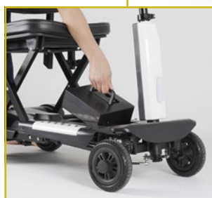
Batería extraíble para facilitar su carga.