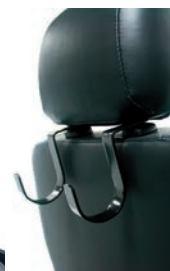
Colgadores para bolso