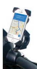
Soporte para móvil