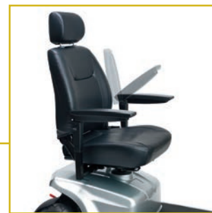
Reposabrazos abatibles y regulables en altura y anchura