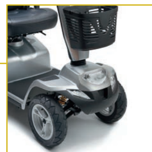
Suspensión delantera. Con luces de freno, delantera, intermitente y emergencia