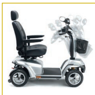
Columna de conducción regulable