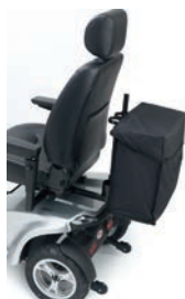
Bolsa trasera con portabastones doble