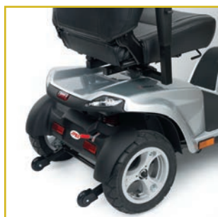
Suspensión trasera. Palanca de desembrague y ruedas antivuelco